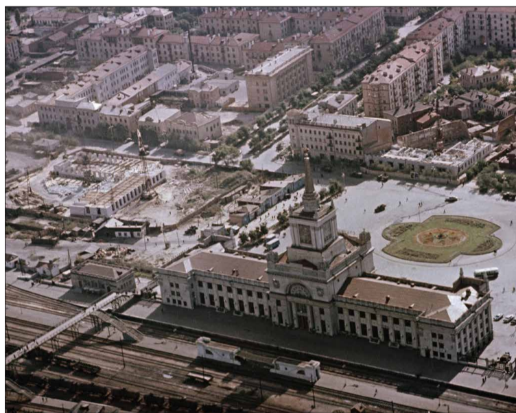
Дом печати в Волгограде построили в 1960 году.

Еще один юбилей Волгоград может отметить в этом сложном году: 55 лет назад в городе появилось предприятие, занимающееся отоплением и горячей водой. Как и во всех других коммунальных историях, путь этот был длинным и извилистым.