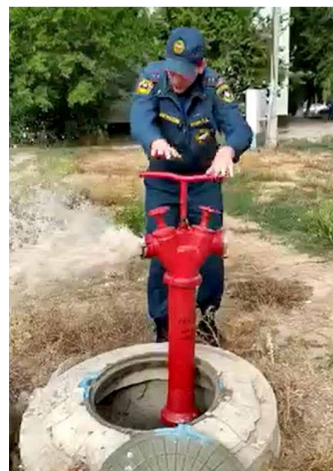
Вода пошла — гидрант исправен.

Если есть неполадки — их устраняют: ремонтируют или меняют гидрант на новый. С начала года «Концессии водоснабжения» установили 123 новых гидранта взамен вышедших из строя. Если есть необходимость — меняют и таблички, указывающие на расположение пожарных гидрантов. Кстати, если вы видите такую табличку — отнесите к ней бережно. Однажды она может спасти кому-то жизнь — поможет пожарным быстрее начать тушить огонь. Плановые обследования проводят два раза в год — весной и осенью. Исправная работа противопожарной инфраструктуры — одна из основ безопасной жизни в большом городе.