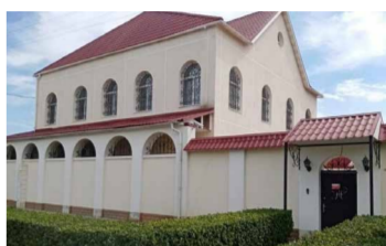
Несмотря на долги за услуги ЖКХ, по коттеджам можно заметить, что неплательщики далеко не бедствуют.

производства. Водопроводно-канализационное хозяйство нуждается в ежедневном обслуживании: в ремонте и промывке труб, в закупке расходных материалов, в специализированном оборудовании и электроэнергии, на которой работает это оборудование. Вода из Волги сама себя не очистит и до крана не доставит: производство чистой воды — это труд тысяч людей, которым нужно платить зарплату. Чтобы город всегда был снабжен ресурсом, рабочие трудятся в любое время суток, при любой погоде, зачастую — в тя-