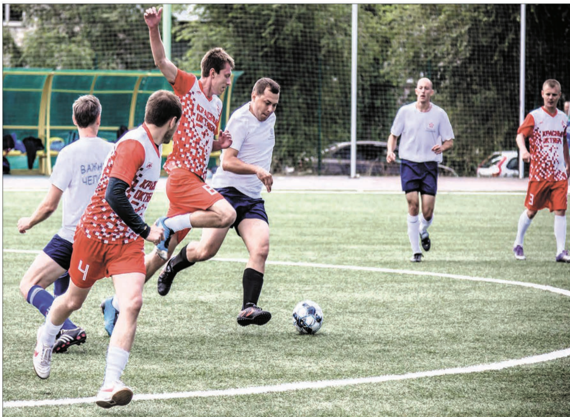
Сборная команда «Коммунальщик» заняла второе место турнира «Кубок Александра Никитина. Легенда №10». Игры прошли в рамках празднования Дня молодежи на стадионе «Нефтяник». Сборная «Коммунальщик» (в белом) состояла из сотрудников концессий водо- и теплоснабжения. Игра с командой завода «Красный Октябрь» (в красном) вывела дебютантов турнира на 2-е место. А чемпионом стала сборная журналистов «Медиа Юнайтед».

Учредитель и издатель: ООО «Объединенные коммунальные концессии» г. Москва, ш. Варшавское, д.95, к.1, пом. XXXII, эт.4, ком. 6 Адрес редакции: г. Волгоград, ул. Пархоменко, 47а. Главный редактор: Степнова А. В. kommunalka34@mail.ru Отпечатано в ООО «Полиграфический комбинат «Царицын», г. Волгоград, ул. Коммунистическая, д. 11. Подписано в печать 19.07.2019: по графику — в 19.00, фактически — в 19.00. Выход в свет 24.07.2019. Заказ № 6964. Распространяется бесплатно. Тираж 87 000 экз. Свидетельство о регистрации СМИ ПИ №ТУ34-00835 от 05.10.2017 выдано Управлением Роскомнадзора по Волгоградской области и Республике Калмыкия