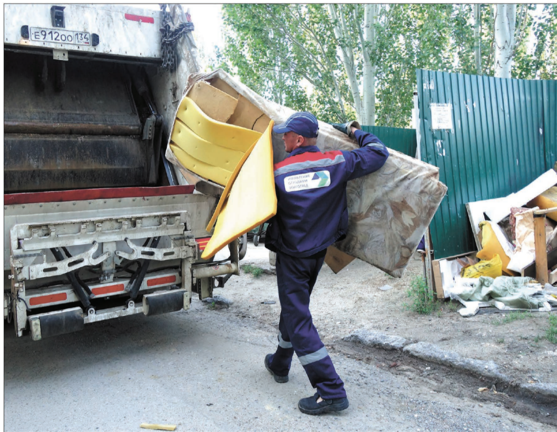
Чтобы ваш диван уехал на полигон, нужен мусоровоз, в кузов которого он поместится, причем с мощным прессом: возить по городу один-единственный диван — расточительство.

На сайтах компаний «Концессии водоснабжения» и «Концессии теплоснабжения» можно узнать подробности акции и скачать заявления на реструктуризацию. Вопросы по сумме долга можно задать на своём участке ИВЦ ЖКХ и ТЭК или по телефону 74-26-26.