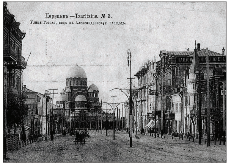
Царицын — Tzaritzine. № 3. Улица Гоголя, вид на Александровскую площадь.