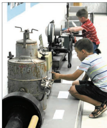
Музей тепла находится в Центральном районе, ул. Советская, 26а. Вход со двора со стороны ул. Гагарина, дверь у 1-го подъезда.

Гостям расскажут малоизвестные факты об истории тепла, например, почему в Волгограде так и не построили атомную теплоэлектростанцию. Посетители узнают, как работают городские котельные и когда началось централизованное теплоснабжение Сталинграда. Экскурсии будут интересны детям и взрослым. Вход в музей бесплатный, но предварительная запись обязательна. Телефон для записи: 8-904-407-68-77, с 10 до 18 час.