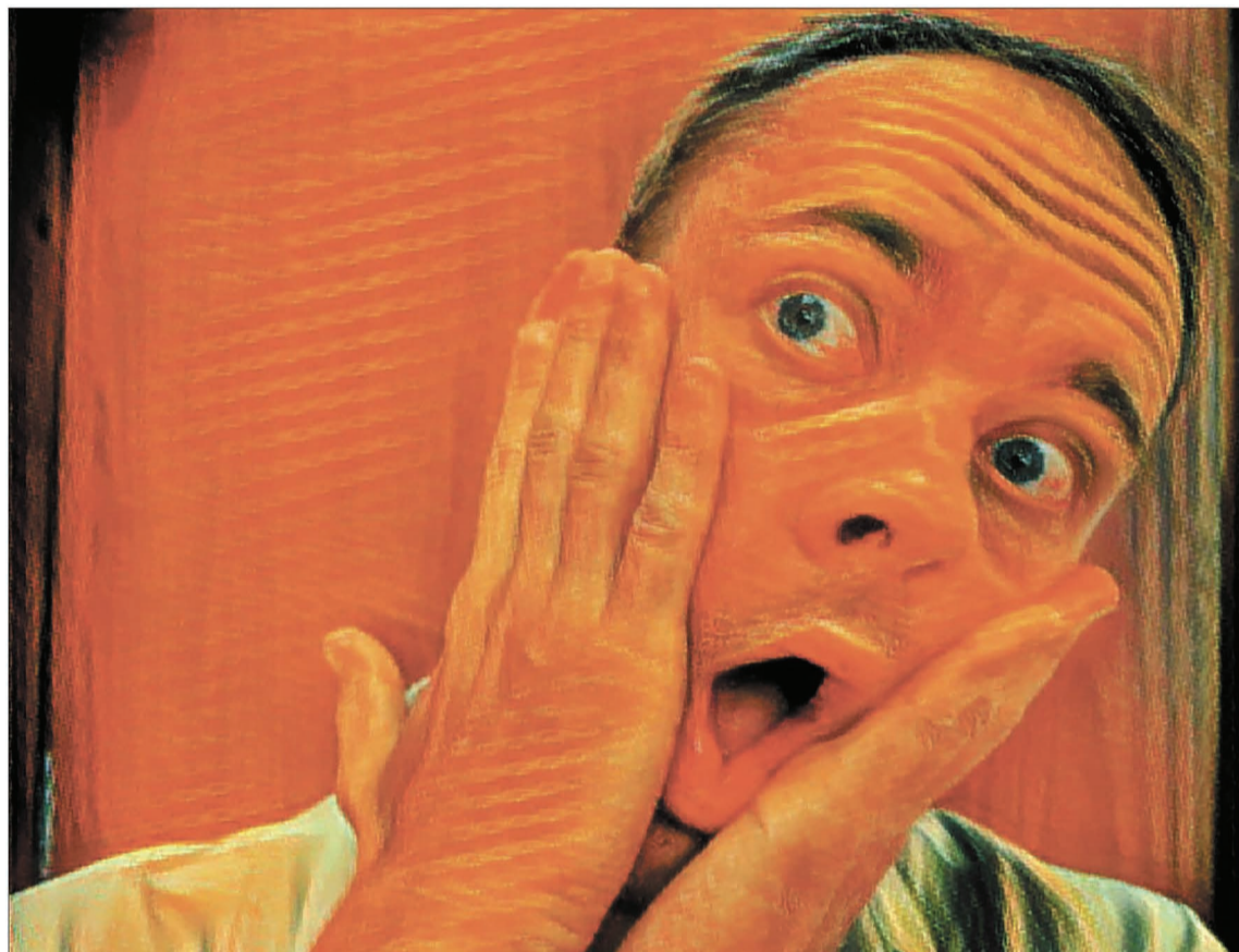
Без паники, граждане! Когда долги копятся, на них снежным комом налипают пени, вырваться из порочного круга поможет реструктуризация от компаний-концессионеров.

В прошлом году для подростков, работавших на Главной канализационной насосной станции, приятным бонусом стало участие в телесюжете канала «Россия».