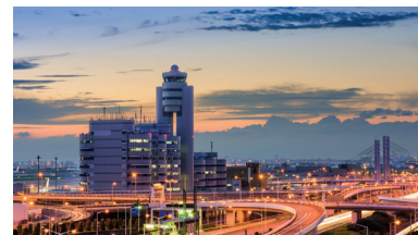
Международный аэропорт Ханэда (Haneda Airport), Токио, Япония. В 2010 году по концессии введены в эксплуатацию международный пассажирский и грузовой терминалы, а также новые стоянки для воздушных судов.