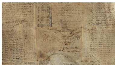
Оборотная сторона водной инфраструктурной облигации на предъявителя, выпущенной голландским советом по водным ресурсам в 1648 году. Информация о выплате процентов записывалась на оборотной стороне облигации до 1943 года. Хранится в библиотеке Йельского университета, США.