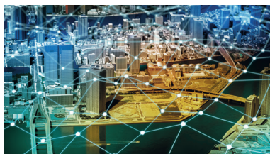
Современная городская диорама с изображением интеллектуальной сети.