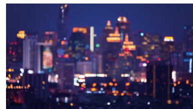
Огни ночного города.