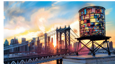
Арт-объект «Водонапорная башня», установленный на крыше действующей водонапорной башни неподалёку от Бруклинского моста в Нью-Йорке, США. Арт-объект является произведением бруклинского художника Тома Фруина (Tom Fruin) и создан из вторичных материалов – металла, плексигласа и оргстекла. В тёмное время суток и до утра «Водонапорная башня» освещается изнутри в определенной последовательности, демонстрируя динамичный характер Бруклина.