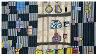
Фрагмент оформления фасада одного из красивейших инфраструктурных объектов мира – мусоросжигательного завода Шпиттеллау (Spittelau) в Вене, Австрия. Завод создан по проекту выдающегося австрийского художника и архитектора Ф. Хундертвассера (Friedensreich Hundertwasser).