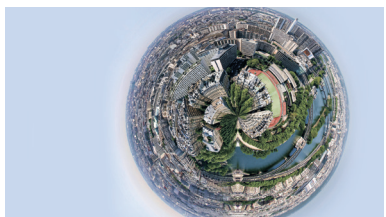
Панорама Парижа, Франция, с высоты Эйфелевой башни. Эйфелева башня, ставшая одной из самых популярных достопримечательностей Парижа, была построена в 1889 году по концессии.