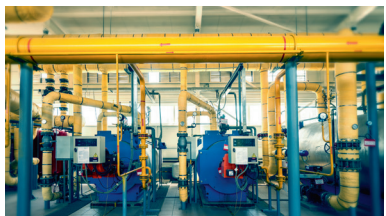
Новая котельная в Волгограде, Россия, построенная ООО «Концессии теплоснабжения» в рамках реализации концессионного соглашения.