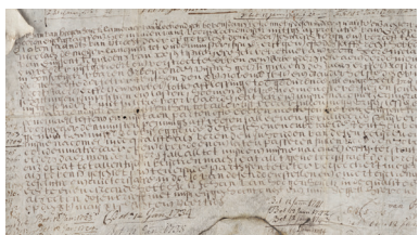
Лицевая сторона водной инфраструктурной облигации на предъявителя, выпущенной голландским советом по водным ресурсам в 1648 году. Хранится в библиотеке Йельского университета, США.