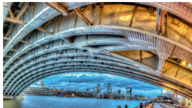
«Солнечный» мост Блэкфрайерс (Blackfriars Bridge) в Лондоне, Великобритания. Викторианский мост, пересекающий Темзу в центральной части Лондона, был построен в 1886 году. Компания Network Rail Limited начала перестройку объекта, и в 2014 году при поддержке японской корпорации Panasonic была смонтирована и запущена в эксплуатацию инновационная «солнечная» крыша.