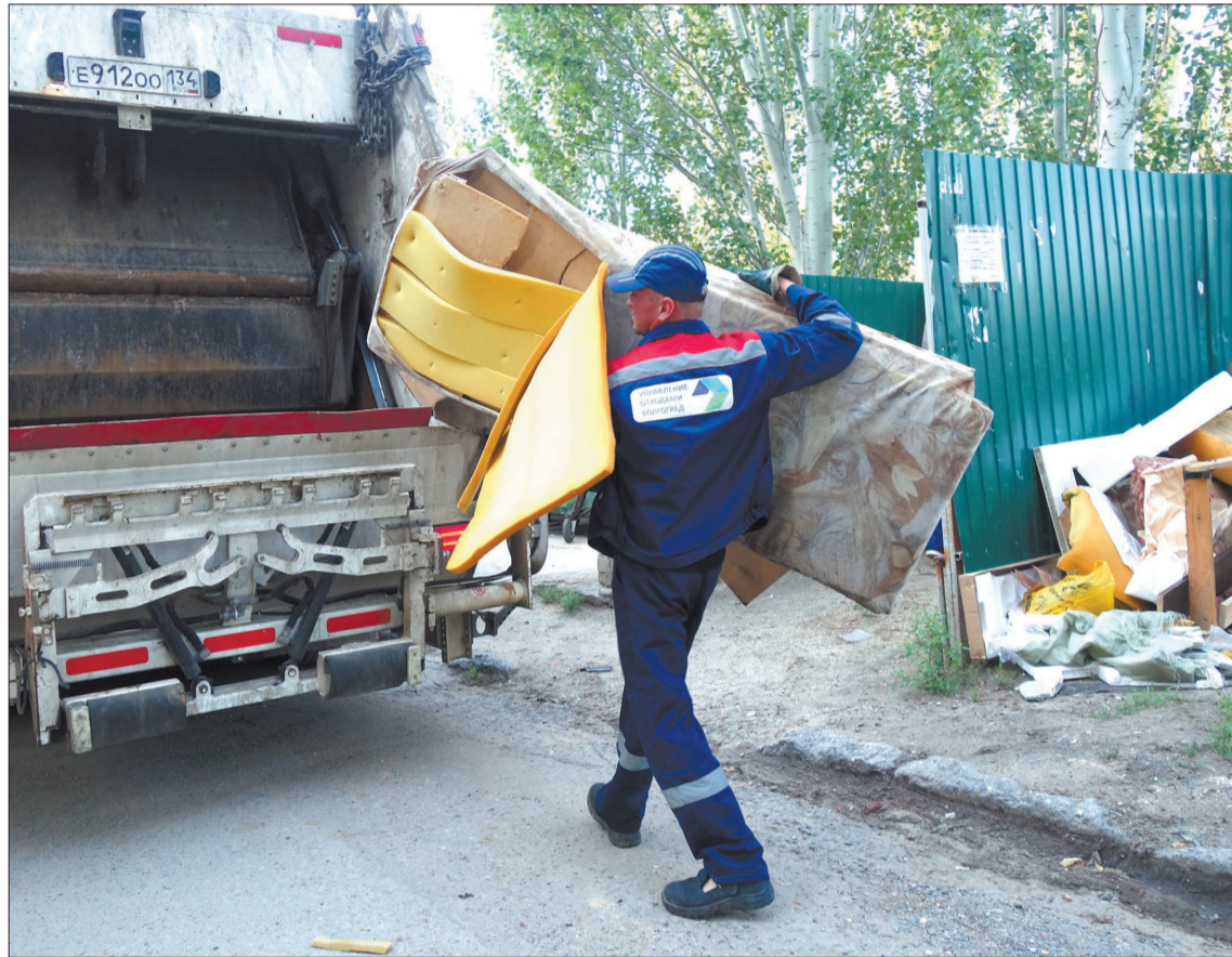
Чтобы ваш диван уехал на полигон, нужен мусоровоз, в кузов которого он поместится, причем с мощным прессом: возить по городу один-единственный диван — расточительство.

На сайтах компаний «Концессии водоснабжения» и «Концессии теплоснабжения» можно узнать подробности акции и скачать заявления на реструктуризацию. Вопросы по сумме долга можно задать на своём участке ИВЦ ЖКХ и ТЭК или по телефону 74-26-26.