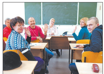
В Учебном центре можно получить вторую специальность, а можно и научиться с нуля.

Учебный центр «Концессий водоснабжения» готовит специалистов сразу по нескольким рабочим специальностям, востребованным в коммунальном хозяйстве. Среди них — пробоотборщик, оператор на песколловках и жироловках, оператор очистных сооружений, машинист насосных установок, оператор хлораторных установок, слесарь аварийно-восстановительных работ, оператор на азроотенках, оператор на фильтрах, слесарь-ремонтник. Уже скоро можно будет обучиться специальности стропальщика и ряду других профессий, востребованных в компании. При этом компания гарантирует трудоустройство, своевременную оплату труда и полный социальный пакет.