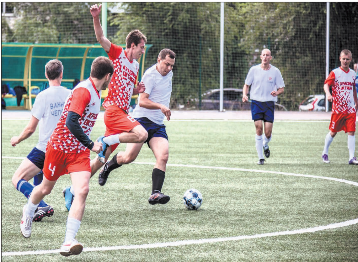
Сборная команда «Коммунальщик» заняла второе место турнира «Кубок Александра Никитина. Легенда №10». Игры прошли в рамках празднования Дня молодежи на стадионе «Нефтяник». Сборная «Коммунальщик» (в белом) состояла из сотрудников концессий водо- и теплоснабжения. Игра с командой завода «Красный Октябрь» (в красном) вывела дебютантов турнира на 2-е место. А чемпионом стала сборная журналистов «Медиа Юнайтед».