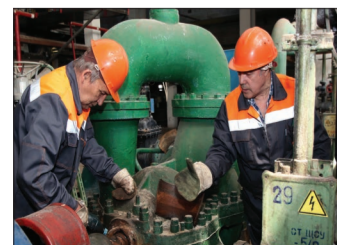
Когда в домах отключают горячую воду, на сетях и в котельных кипит работа.

График отключений ГВС размещен на сайте «Концессий теплоснабжения» teplovolograd.ru в разделе «Потребителям».