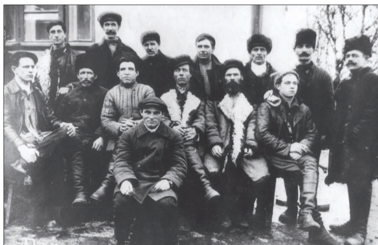
Рабочие горканизации, 1928 г.

С открытием Единого диспетчерского центра (о нём — на стр. 1) волгоградская коммуналка шагнула в XXI век. И это повод вспомнить, как всё начиналось. Когда в нашем городе появились диспетчеры, управляющие сетями?