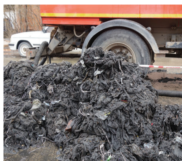
Если каждый из нас спустит в унитаз по одной тряпочке, с канализацией придется попороться надолго.

ВАЖНО В унитаз нельзя выбрасывать хозяйственно-бытовой мусор, предметы личной гигиены, пакеты, стекло и пластик. В мусоропровод, а не в унитаз, следует отправлять и остатки еды, кости, жирные соусы и масла. А сброс в канализацию строительного мусора абсолютно недопустим! Это неизбежно будет приводить к порче канализационных коллекторов и, как следствие, к трудноустраняемым засорам. Водоканал напоминает: канализация предназначена исключительно для жидких бытовых отходов, для всего остального есть мусорное ведро.