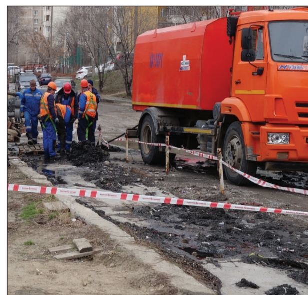
Мощная каналопрямочная машина не смогла справиться с засором на ул. Хользунова, устранить пришлось вручную.

Смывая в унитаз тряпочку, горожанин думает (если думает, конечно), что одна маленькая тряпочка никому не помешает. И две... И три... А сто? А тысяча? Вспомните об этом, когда решите, что от вас одного ничего не зависит. Когда так думает каждый второй, страдает коммунальное — общее — хозяйство.