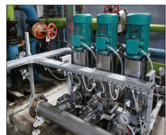
Внутри ЦТП находятся насосы, задвижки и теплообменники.

Помимо ЦТП есть еще индивидуальные тепловые пункты. Они работают по тому же принципу, что и центральные, за одним лишь исключением — стоят внутри конкретных домов и обслуживают только их. Всего на территории нашего города расположено 275 ЦТП.