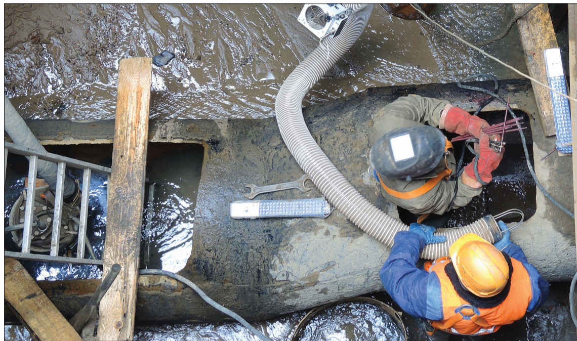
Коммунальщики приносят тепло и уют в дома горожан, но условия их собственной работы не предполагают ни того, ни другого.

Укладку асфальта вокруг новых павильонов начали с Советского района, следующие Кировский и Красноармейский. Всего в этом году предстоит оборудовать более 70 остановочных павильонов, в том числе 19 павильонов в Тракторозаводском районе, семь в Краснооктябрьском, 14 в Дзержинском и Центральном районах. После установки новых конструкций везде будет уложен асфальт.