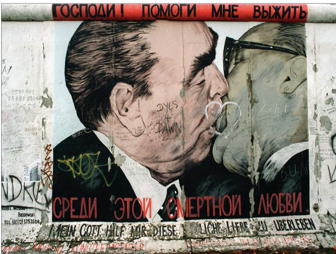
«Помоги мне выжить среди этой смертной любви» — название граффити на Берлинской стене могло бы стать девизом коммунальщиков: визиты Хонеккера, Неру, Де Голля неизменно давали им повод для трудового подвига.

Чинить трубы — дело серьезное и требует высокого профессионализма. Однако и в коммуналке случаются ситуации, которые сами работники вспоминают с улыбкой.