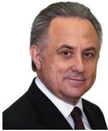
Виталий Мутко, заместитель председателя правительства Российской Федерации

Разница в тарифах на услуги жилищно-коммунального комплекса по регионам имеет объективные причины. Это сложный вопрос. Вот так просто в публичном поле такие вещи заявлять — настолько поверхностно с обывательской точки зрения... Всё намного глубже. Тариф зависит от многих факторов. То, что где-то тариф выше эталонного, — это так, разница между регионами есть и будет, потому что разные условия водоподготовки, теплонаблюдения и так далее. Но каждый год дисбаланс сокращается, в том числе и через тарифное регулирование.