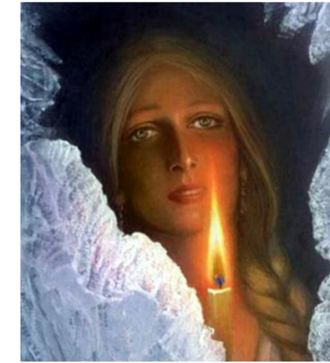
На известной картине К. Васильева опытный глаз коммунальщика сразу заметит проблему — плохая теплоизоляция жилья.

Действующие нормативы на отопление по региону утверждены постановлением Управления по региональным тарифам Администрации Волгоградской области от 08.06.2012 №23. В постановлении правительства РФ №306 от 23.05.2006 г. прописано: при определении норматива на отопление учитываются многие факторы: материал стен и крыши дома, объём жилых помещений, площадь ограждающих конструкций и окон, износ внутридомовых инженерных систем, год постройки и общее количество этажей в доме. Всё это остается неизменным — что в июле, что в декабре. Именно поэтому плата по ним что в октябре, что в апреле, что в другие месяцы отопительного сезона всегда будет одинаковой, — она распределяется равными долями на весь период. Согласно постановлению Управления по региональным тарифам Администрации Волгоградской области №23 нормативы применяются в период, равный продолжительности отопительного сезона (включая неполные месяцы — октябрь и апрель), установленного распоряжением главы администрации Волгограда. Поэтому не важно, стартовал ли отопительный сезон 15 октября, как прежде, или 22 октября, как этой тёплой осе-